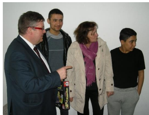
Zu Besuch in der Unterkunft für unbegleitete Jugendliche in Ochsenfurt.